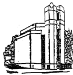
St. Simeon Trier-West